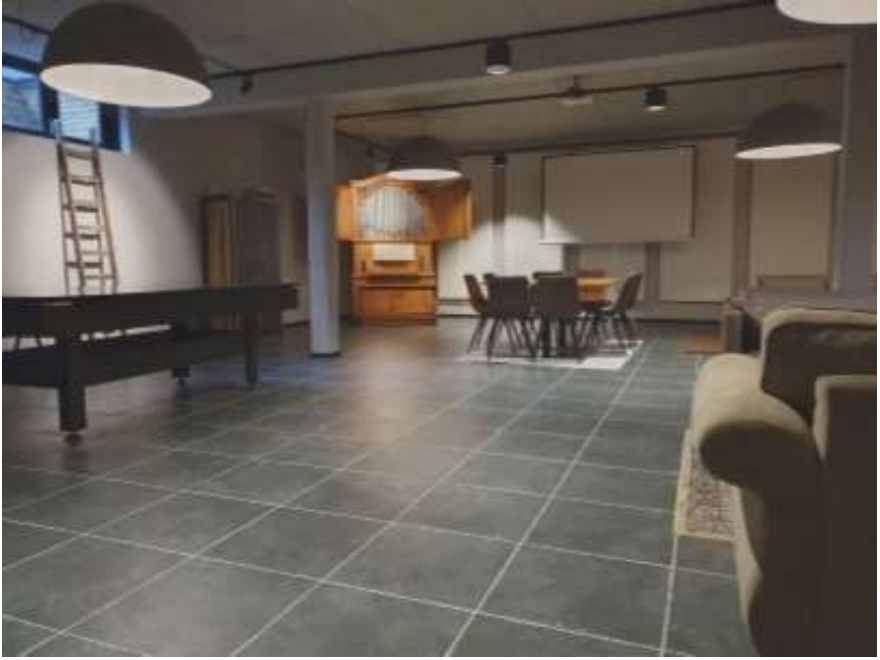
Vierdag-orgel Sluiskil overgeplaatst naar Protestantse Kerk Hulst.