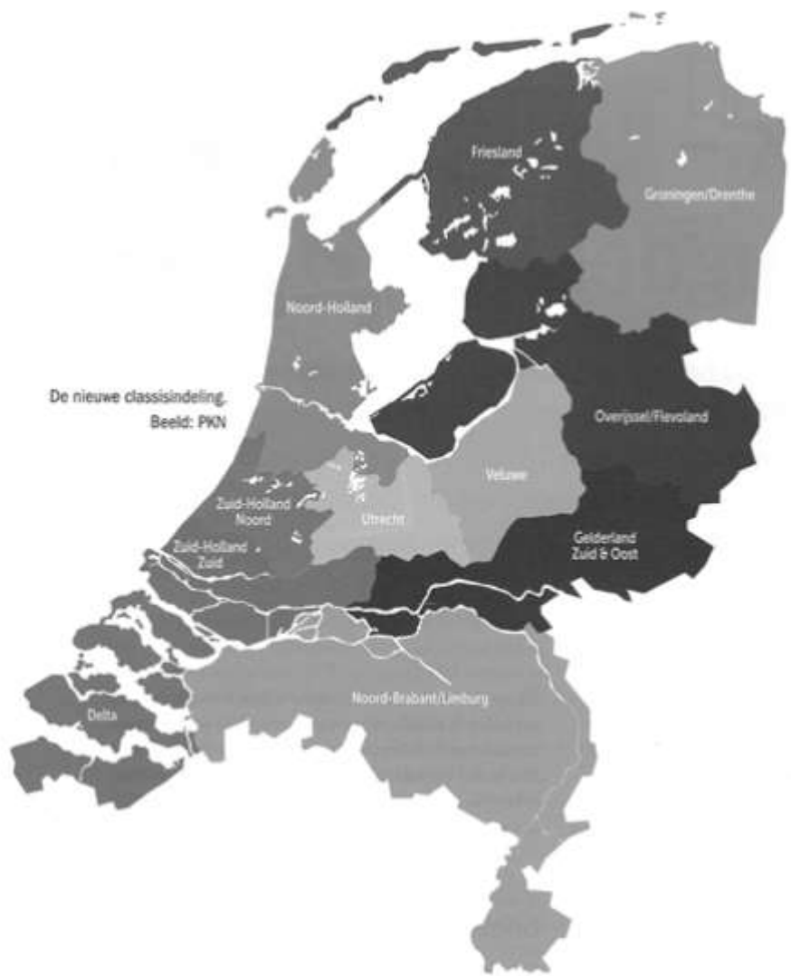
De nieuwe classisindeling.